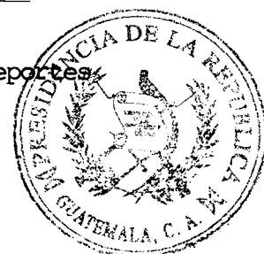
José Luis Chea Urruela Ministro de Cultura y Deportes